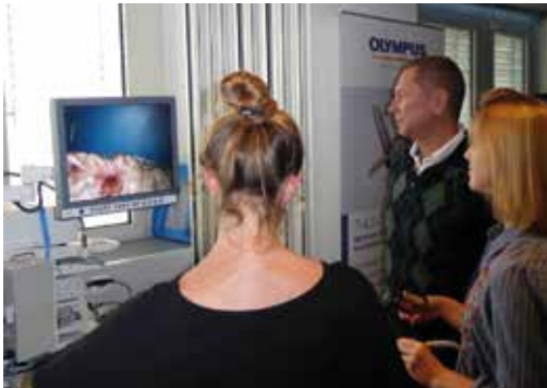
Operationen am Tiermodell